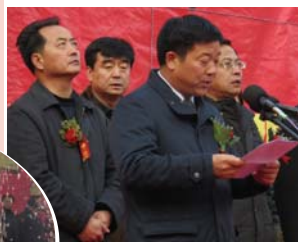
甘肃省国土资源厅党组书记、副厅长,省地矿局局长郭玉政致辞