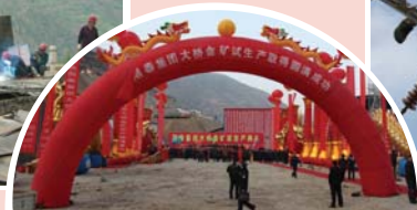
大桥金矿试生产典礼场景