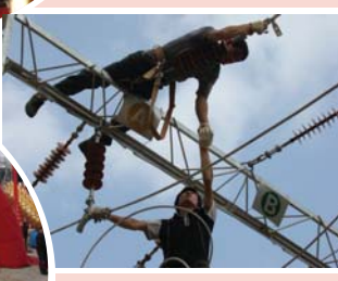
2012年8月9日大桥金矿选冶厂变电站通电