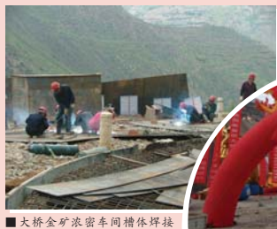
大桥金矿浓密车间槽体焊接